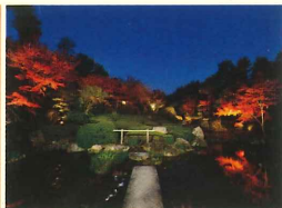
池泉回遊式庭園のライトアップ

【当日の流れ】「本堂(通常非公開)」・枯山水庭園「元信の庭」・日本最古の水墨画「瓢鮎図」のガイド付き拝観 →池泉回遊式庭園「余香苑」の紅葉見学→茶席「大休庵」でのお食事→自由に「余香苑」散策・撮影