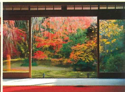
茶席・大休庵からのぞむ秋景色