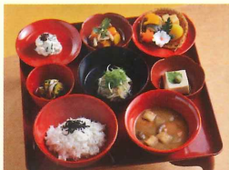
今秋限定「阿じろ」の京の秋御膳